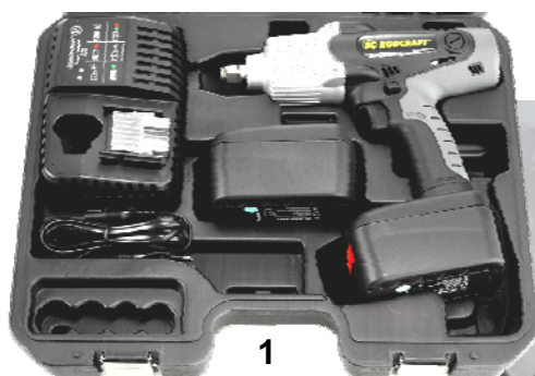
Modell 9026 Artikelnr. 8951077560